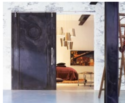
Türsysteme | Door systems