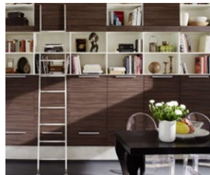
Leitersysteme | Ladder systems